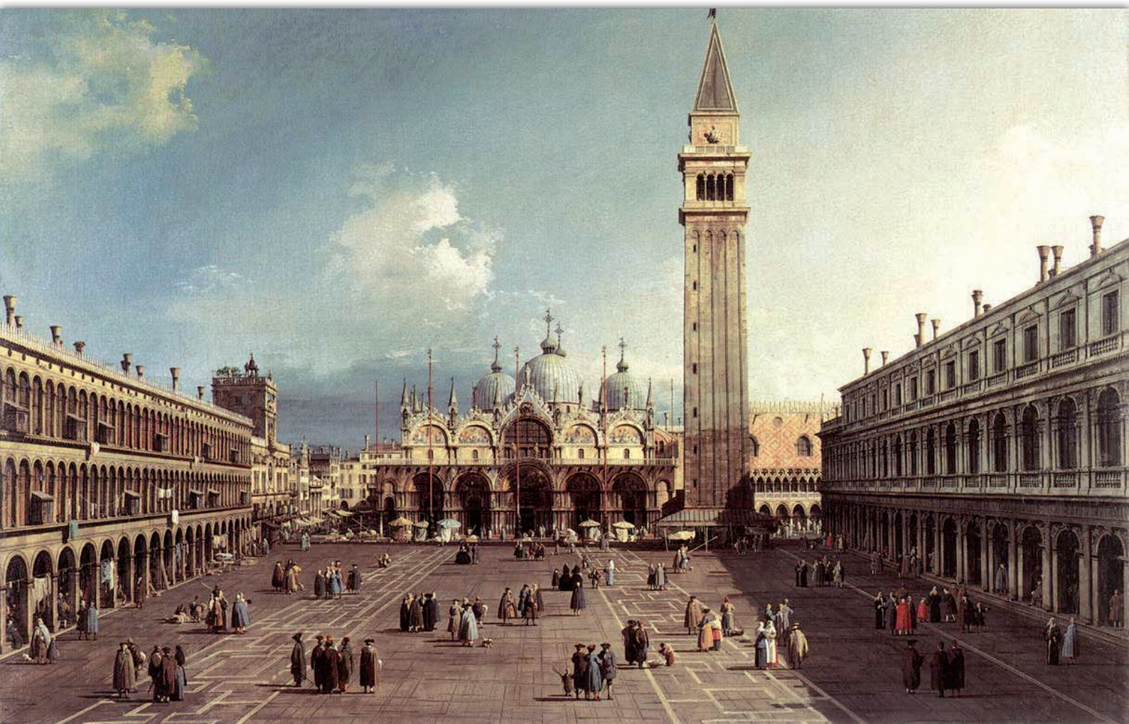
Piazza San Marco con la basilica, Canaletto, 1730, Fogg Art Museum Cambridge