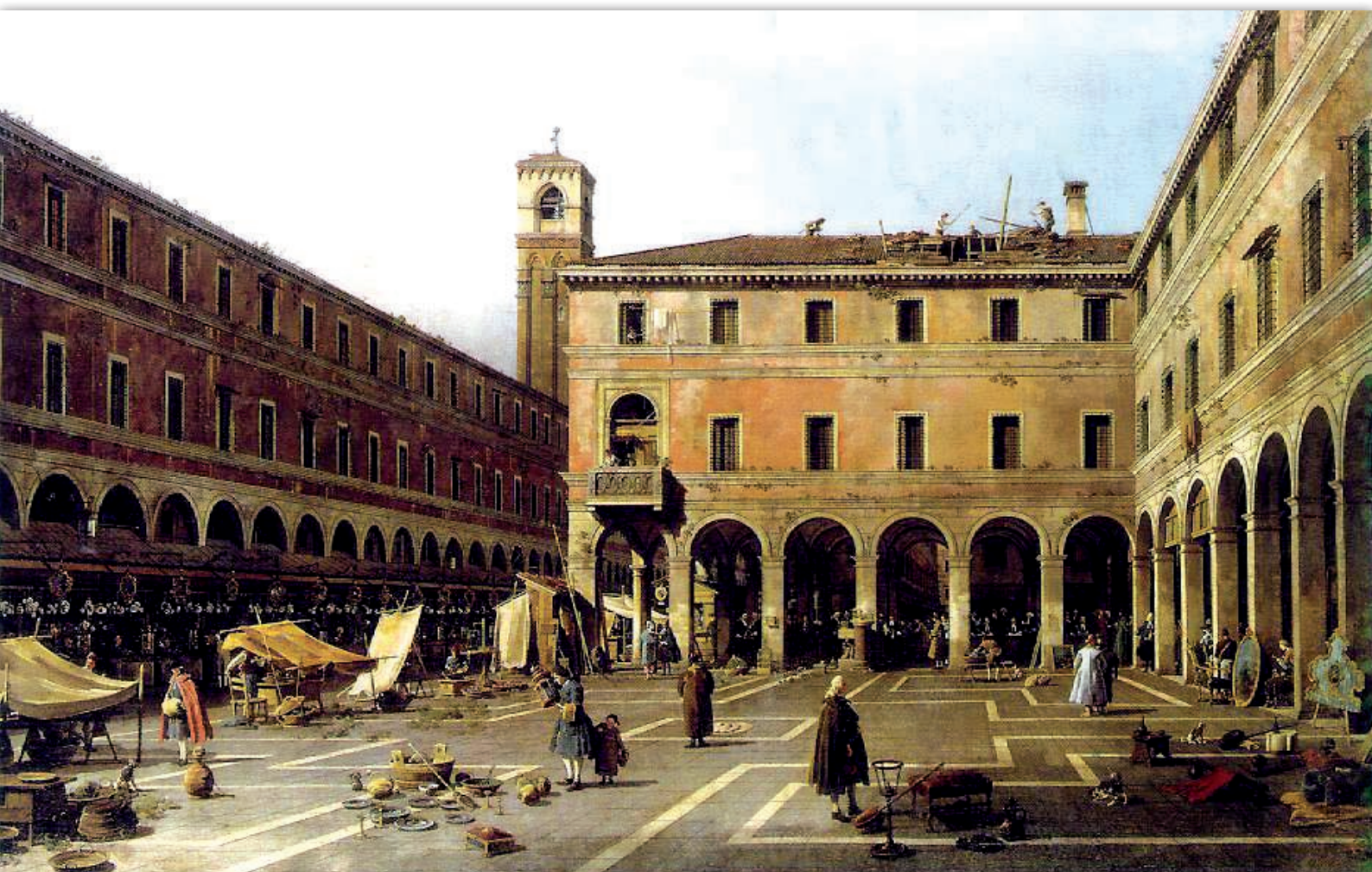
Chiesa dei santi Giovanni e Paolo con la scuola di San Marco, Canaletto 1725, Gemaldegalerie, Dresden